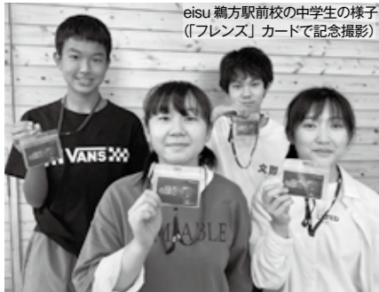
eisu 鶴方駅前校の中学生の様子 （「フレンス」カードで記念撮影）